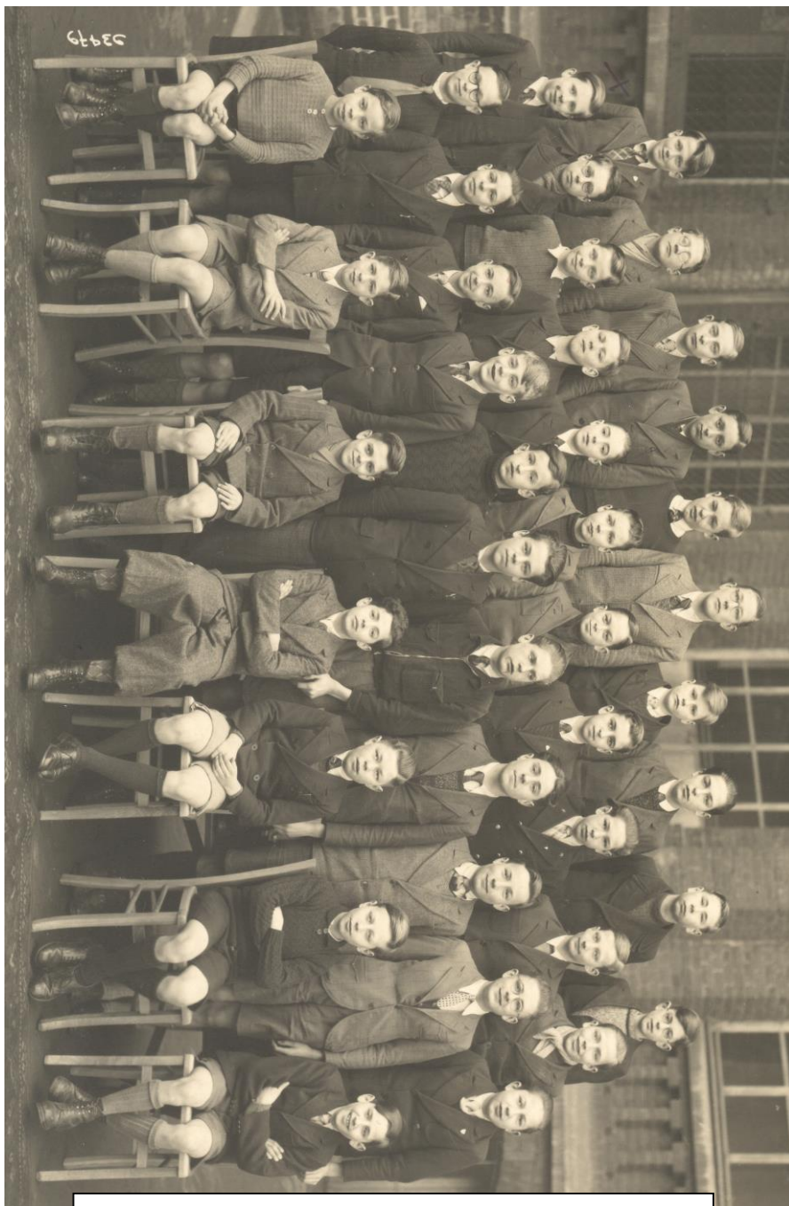
AVIS DE RECHERCHE St Pierre, 1943 - classe de ?

Institution Saint-Pierre Amicale des Anciens de Saint-Pierre 18, rue Saint Jean-Baptiste de La Salle 59000 Lille www.anciens-iso-lille.com